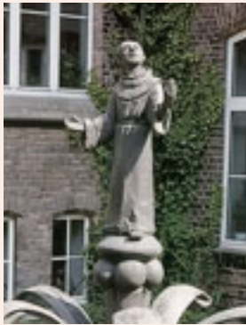
Franziskus von Assisi (1182-1226)